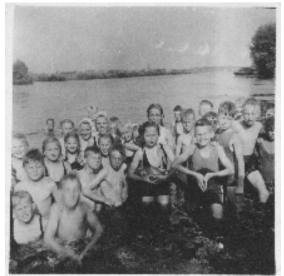
Zwemles in de Oude Rijn, achter bij fam. Bakker waar nu Rijnweide staat.