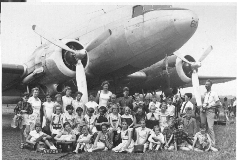
Schoolreisje: Schiphol 1957