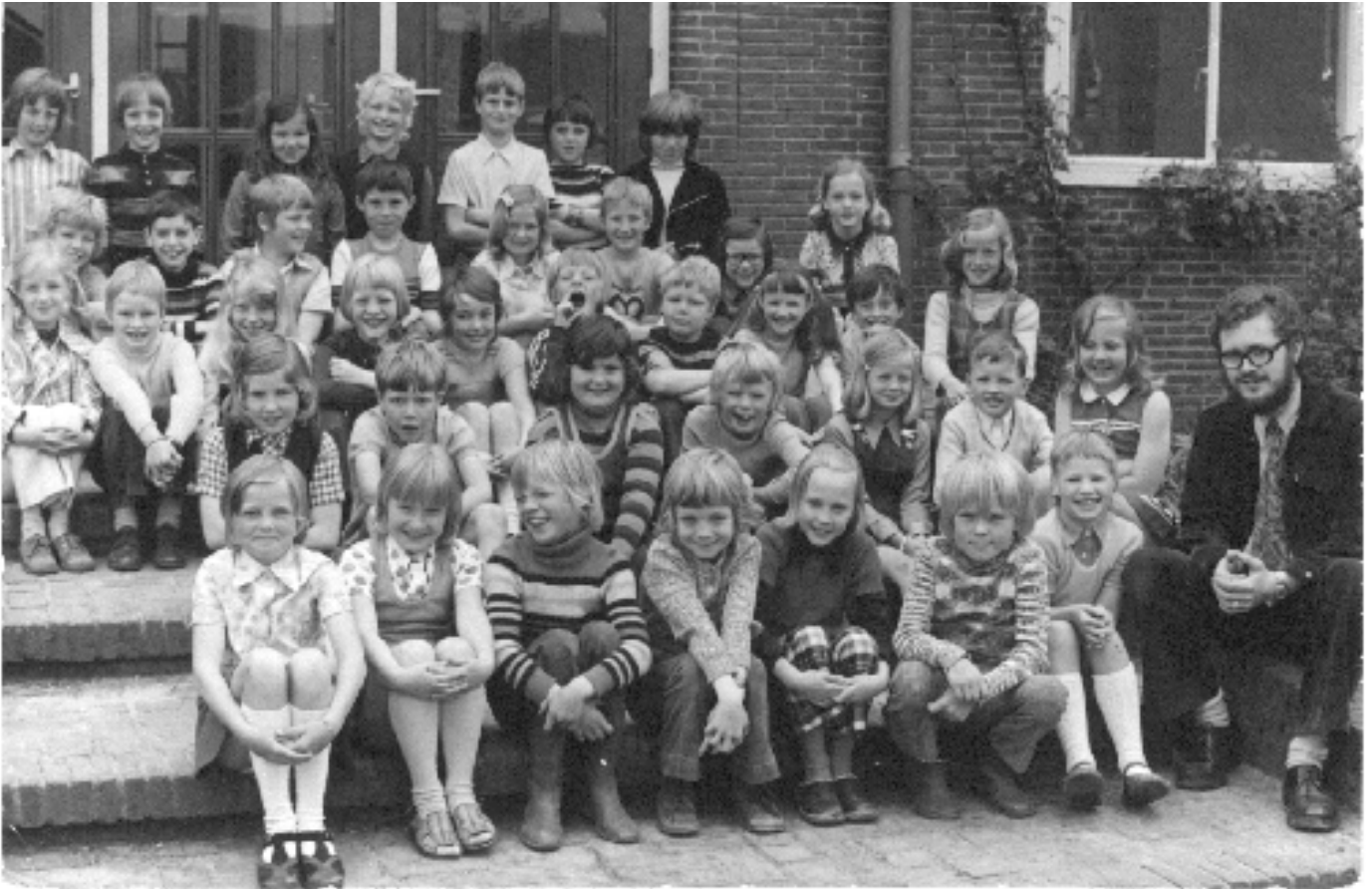
Klas 3 van de School met de Bijbel te Valkenburg. Juni 1973